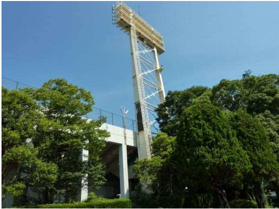
【照明塔全景】 塗装の剥がれ落ち②