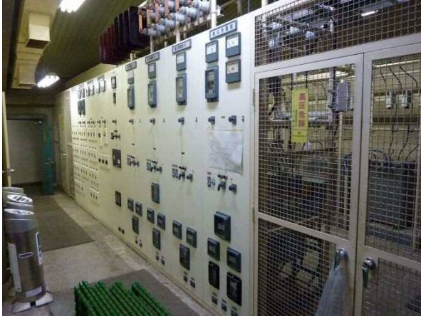
【高圧受変電設備】 40年以上使用