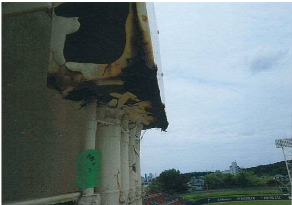
【照明塔全体】 塗装の剥がれ落ち①