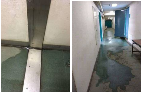
【廊下雨漏り】 壁を伝い、廊下全体が浸水