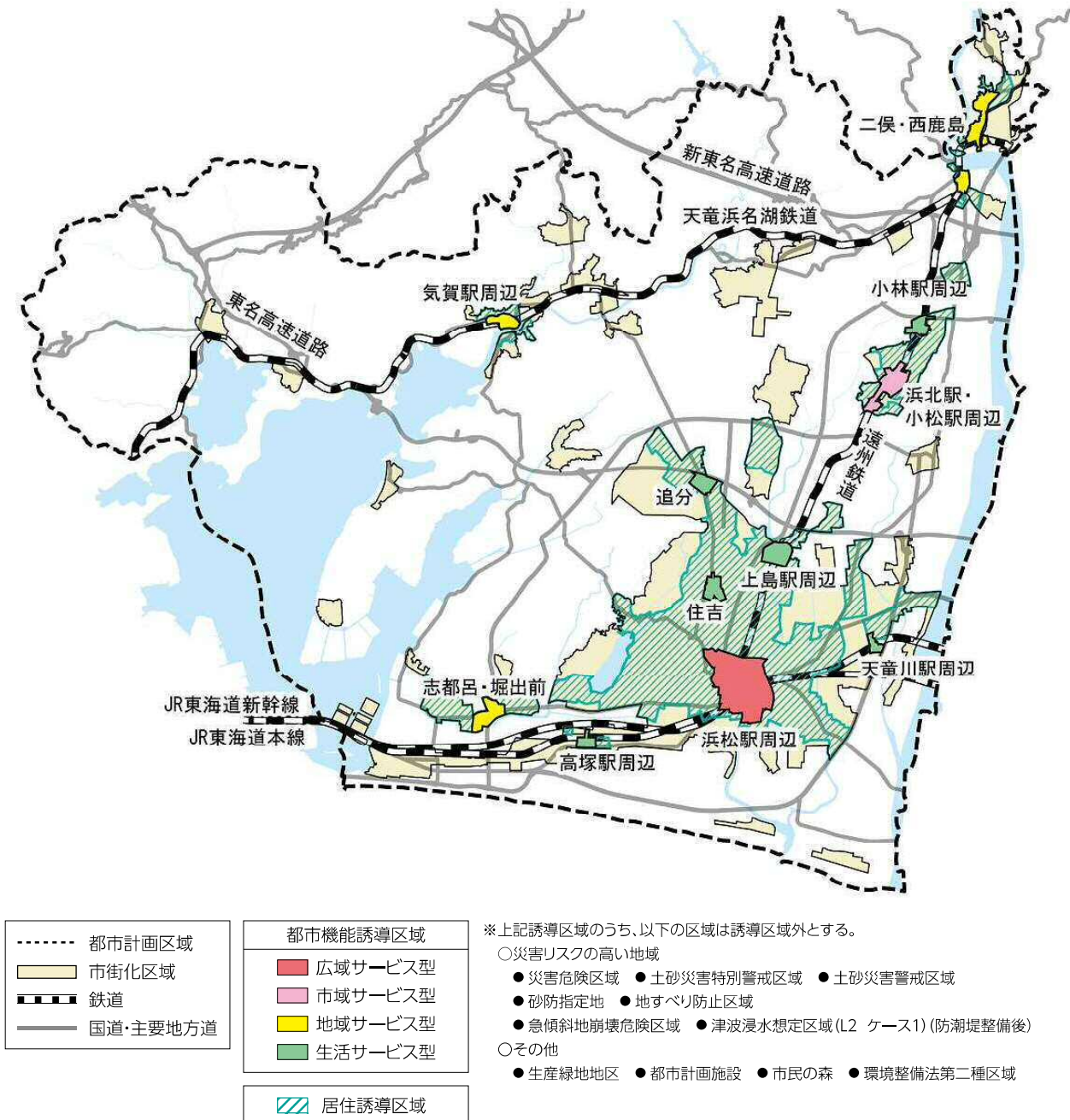
図 4-2 都市機能誘導区域