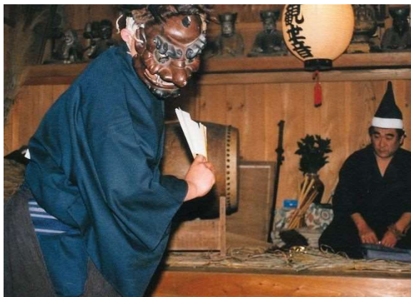
図 2-10 西浦の田楽

この他、指定物件こそみられないものの、織物、楽器、輸送機器の製造に関わる産業関係の遺産は、本市を特徴づける文化財といえるだろう。