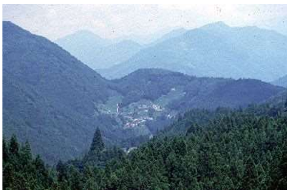
図 2-3 ホウジ峠の中央構造線

原始古代に関連する文化財 蜷塚遺跡（中区、国史跡）は縄文時代後期から晩期にかけての貝塚を伴う集落遺跡として東海地方でも有数の規模をもつ。続く弥生時代を象徴する考古資料としては、銅鐸が知られる。浜名湖北岸域は全国的にみても銅鐸が集中する地域として著名であり、この地域で出土した銅鐸のうち本市では 7 口（県有形もしくは市有形）を所有する。いずれも 1～2 世紀の弥生時代後期のものである。銅鐸の埋納状態が確認できた滝峰才四郎谷遺跡（北区、県史跡）のような事例もある。