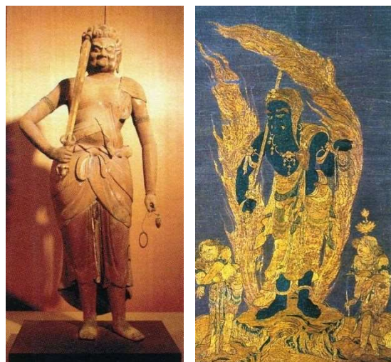
図2-4 真言宗関連文化財 （左：木造不動明王像立像（摩訶耶寺）、 右：刺繍不動明王二童子像掛幅）

長楽寺（北区）は、弘法大師が大同年間（806年～810年）に創建したと伝える真言宗寺院であり、木造馬頭観音坐像（鎌倉時代か、市有形）を有する。梵鐘（鎌倉時代、県有形）は、県内でも古い嘉元3年（1305年）の銘がある。長楽寺庭園（江戸時代、