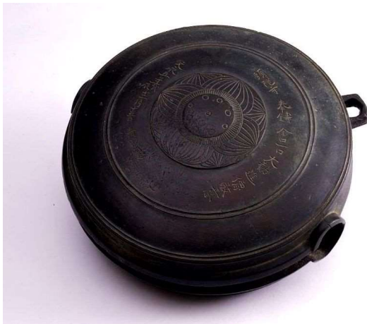
図2-7 鱈口（文永五年の銘がある）