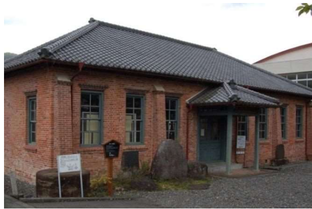
図 2-11 旧王子製紙製品倉庫