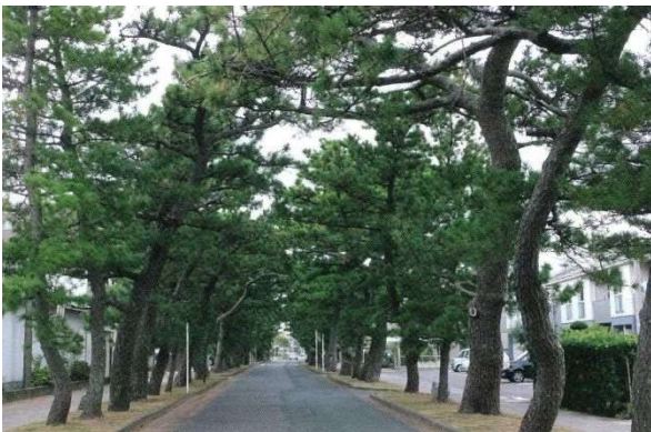
図2-9 東海道の松並木

り、火伏の信仰を広く集める。江戸時代は、秋葉大権現をまつる秋葉社と三尺坊をまつる秋葉寺が一体となった神仏習合の霊山であった。現在、秋葉神社には3口の太刀（鎌倉時代、国重文）を含む奉納刀剣が豊富に伝えられているほか、秋葉神社神門（江戸時代、市有形）や秋葉神社社叢（市天然記念物）などに江戸時代の景観をうかがうことができる。