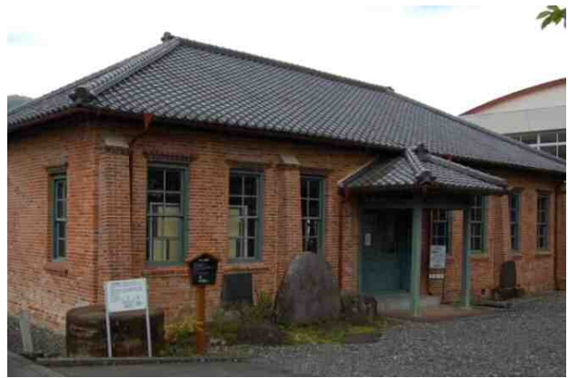
図 2-11 旧王子製紙製品倉庫