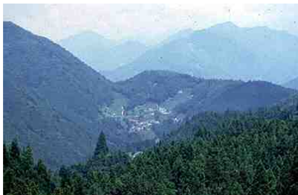
図 2-3 ホウジ峠の中央構造線

原始古代に関連する文化財 しじみづか 蜆塚遺跡（中区、国史跡）は縄文時代後期から晩期にかけての貝塚を伴う集落遺跡として東海地方でも有数の規模をもつ。続く弥生時代を象徴する考古資料としては、銅