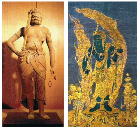
図2-4 真言宗関連文化財 (左:木造不動明王立像(摩訶耶寺)、 右:刺繍不動明王二童子像掛幅)

長楽寺(北区)は、弘法大師が大同年間(806年～810年)に創建したと伝える真言宗寺院であり、木造馬頭観音坐像(鎌倉時代か、市有形)を有する。梵鐘(鎌倉時代、県有形)は、県内でも古い嘉元3年(1305年)の銘がある。長楽寺庭園(江戸時代、