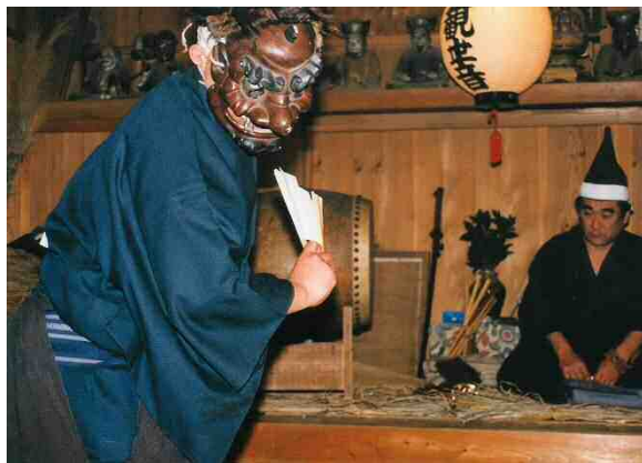
図 2-10 西浦の田楽

この他、指定物件こそみられないものの、織物、楽器、輸送機器の製造に関わる産業関係の遺産は、本市を特徴づける文化財といえるだろう。