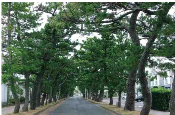
図2-9 東海道の松並木