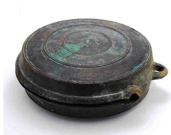
図2-7 鱈口（至徳二年の陰刻銘あり）