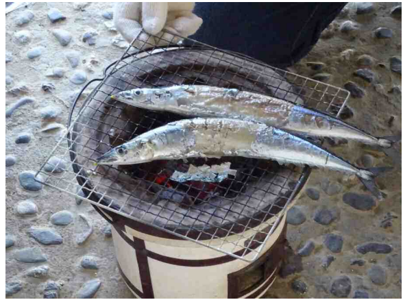
図 5-8 七輪で魚焼き体験

学校を中心にした移動博物館は教育現場の要請と調整し、引き続き開催を続ける。また、学習指導要領に即した事業を進め、夏休みの自由研究相談などを行う。