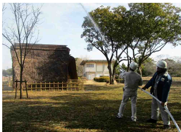
図 5-3 蛸塚公園における防火訓練

さらに、毎年1月26日に実施される文化財防火デーに各地で行われる防火訓練をはじめ、各訓練への積極的な参加を関連部署や関連構成員・構成団体に働きかける。特に、重要文化財建造物については、消防庁が示す「国宝・重要文化財（建造物）等に対応した防火訓練マニュアル」に基づ