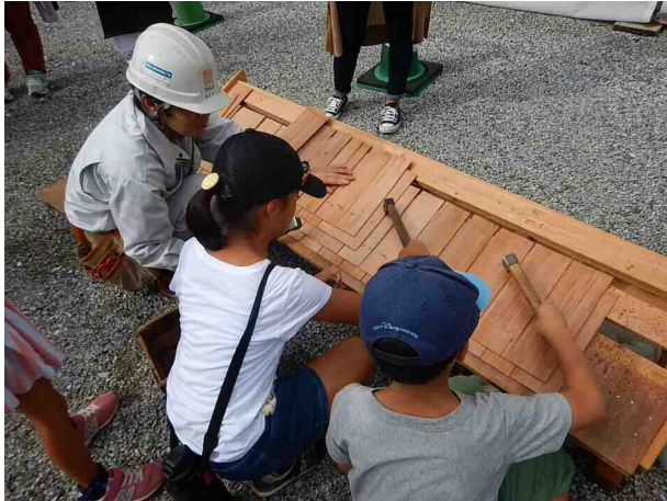
図5-5 こけら葺き体験

活用についても、学習指導要領等の内容を踏まえ、効果的な活用事業を進める。市は、地域遺産センターや博物館及びその分館を有効活用し、効果的な活用事業を行う。施設に関する具体的な取組については後述する。また、市が主催するシンポジウム、講座といった活用事業も継続的に進める。