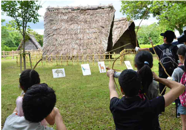
図 5-7 縄文時代の狩り体験