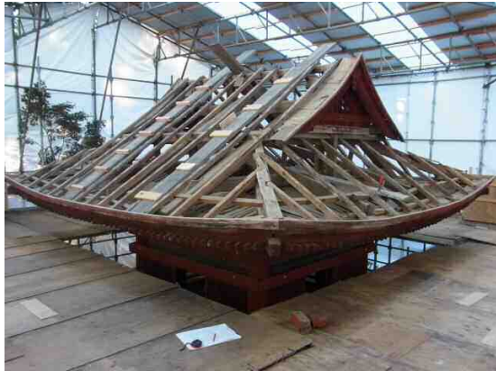
図5-1 建造物保存修理状況 (瑞雲院鐘楼 天竜区)

もに、保存修理事業を計画的に進めるように努める。重要な建造物や美術工芸品の修理については、可能な限り事業のリスト化を進め、計画的に実施する。建造物や彫刻をはじめとした有形文化財等については、日常的な管理に伴う小規模な修理を進めるほか、建造物については、定期的な屋根の葺き替え、解体修理等の大規模修理を計画的に行う。民間所有の有形文化財等に関する大規模な修理は、所有者の要請に応じ、補助事業等によって実施する。