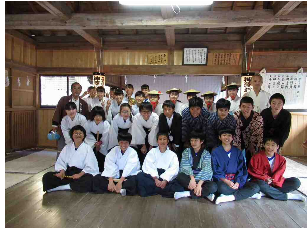
図5-4 中学生による祭礼参加 (清竜中学校 神澤のおくない)

市職員の人材育成 本市では、文化財の保存と活用に関する事業を効果的に進めるため、地域の文化財を総体として把握し、その保存と活用のための計画等を立案し、実行できる人材の育成に努める。また、文化財担当職員の資質能力は、自己研鑽と組織的な育成によって絶えず向上が図られるという意識のもと、各職員に国や県が主催する研修等に参加するように促す。