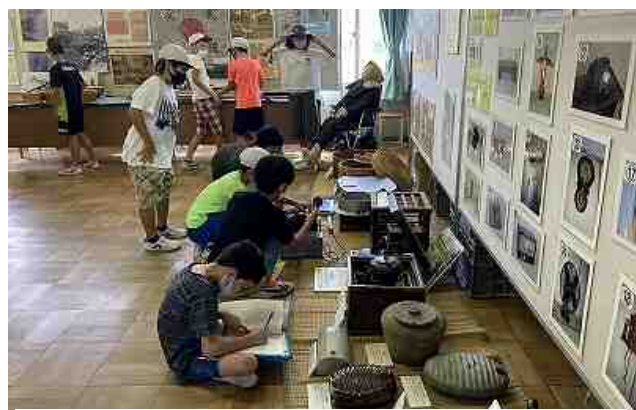
図5-6 学校移動博物館