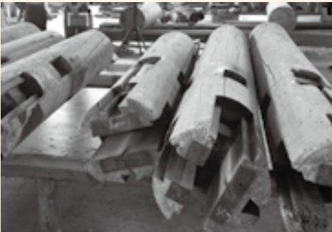
バラバラになった柱。木組の様子も分かる

二〇二〇年に始まり、二〇二一年現在も進行中です。全解体では、柱や梁(はり)などの部材をバラバラにします。壮大な神門はいったん地上から姿を消しました。その後、倉庫で部材を点検し、再利用できる部材や未来の修理の参考になる保存部材を確認しました。