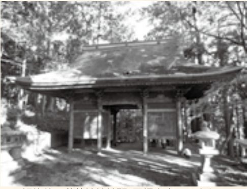
解体前の秋葉神社神門。屋根中央には穴も…

文 化財に指定されることもある日本の伝統建築。その主要部材は木材で、屋根は植物性材料であることも多いことから、風雨にさらされ劣化します。このため、木造文化財建造物は定期的に修理を施して未来につないでいきます。修理の方法は状況に応じてさまざま。傷みなどの程度に合わせて、屋根の葺き替えや半解体、全解体といった工事の方針を定めます。