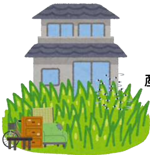
産業廃棄物等の 不法投棄