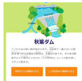
水道の旅コンテンツ