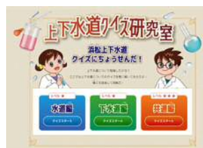
クイズコンテンツ