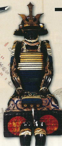
色々糸威二枚胴具足 （名古屋市秀吉清正記念館蔵）