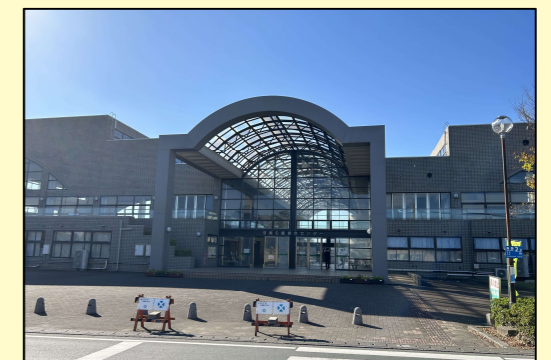
▲可美公園 高塚駅から徒歩約17分