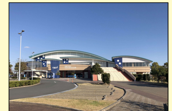
▲古橋廣之進記念浜松市総合水泳場(ToBiO) (遠州灘海浜公園(篠原地区)) 高塚駅から徒歩約30分