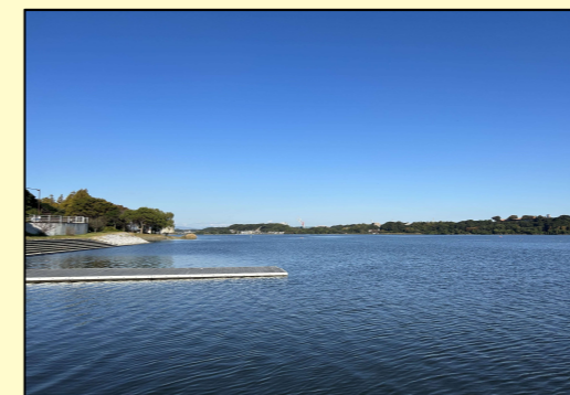
▲佐鳴湖 高塚駅から徒歩約30分