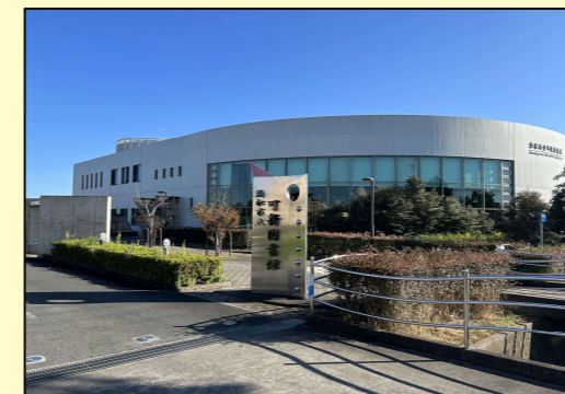
▲可新図書館 高塚駅から徒歩約13分