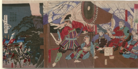
酒井忠次時鼓打之図