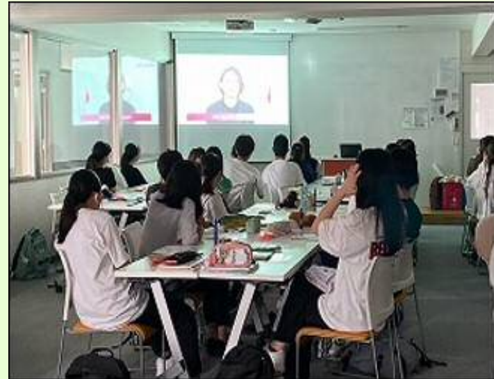
【出前講座・専門学校】