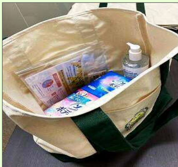
生理用品、相談窓口カード、消毒液など (協力: 杏林堂薬局)