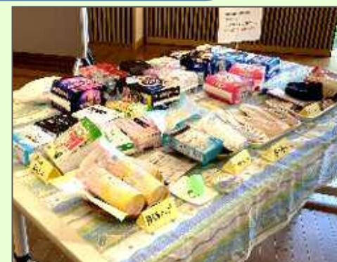
様々な生理用品の紹介