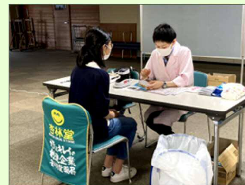
相談コーナー (協力: 杏林堂薬局)