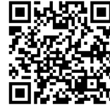
浜松市 HP （職員採用）

災害等の理由により試験の実施について変更などがある場合は、浜松市ホームページ（トップ→職員採用）およびLINE 公式アカウントでお知らせします。 確実な情報配信のため、LINE 公式アカウントの登録をお願いいたします。