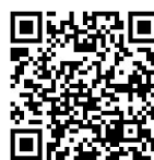
浜松市 HP (職員採用)

新型コロナウイルス感染症や災害等の理由により試験の実施について変更などがある場合は、浜松市ホームページ(トップ→職員採用)および LINE 公式アカウントでお知らせします。 確実に情報を受信いただけるよう、LINE 公式アカウントの登録をお願いいたします。