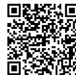
LINE 公式アカウント (職員採用情報)