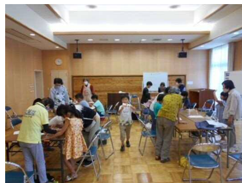
8/18 工作:ダビンチの橋をつくろう

【登録】①篠原協働センター窓口または電話448-7859 (8:30~17:15 日曜・祝日は除く)