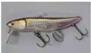
翼原理の応用でロングキャストを実現した「ZZ-DAX」(税込2,450円)。