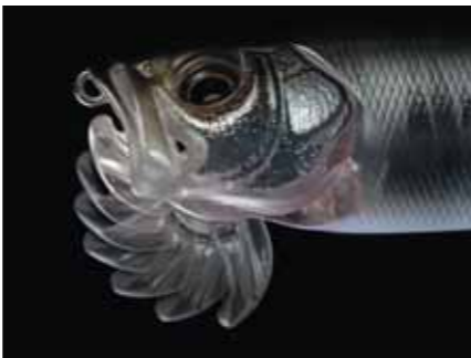
「Xポッド」(税込2,290円)はひとつのルアーで7タイプの特性へと変化。

はよく釣れる反面、向かい風では空気抵抗が増えてポイントまで届かないという悩みを抱えていた。そこで同社では、飛行機の翼原理を応用して「よく飛ぶルアー」の開発に着手。あごの部分に装着した薄型成型の潜行板は泳力を増すためのパーツだが、キャストイング時にこれを風圧で折り畳ませてウイングにしてしまおうという試みだ。海と空を制覇するルアー開発は試行錯誤の連続。冬の間は風を相手に何度もキャストイング