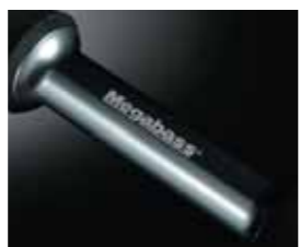
メガバス株式会社 静岡県浜松市東区西ヶ崎町1590-1 TEL 053-431-0777 http://www.megabass.co.jp