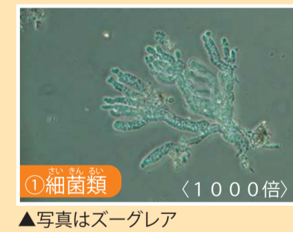
▲写真はスーグレア