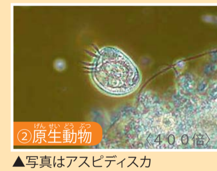
▲写真はアスピディスカ