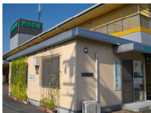
地域包括支援センター白脇 地域包括支援センター芳川

地域包括支援センターが創設され、早いもので6年目を迎えました。各専門職が協力し、地域に暮らす高齢者の皆様を介護・福祉・健康・医療などさまざまな面から支えています。