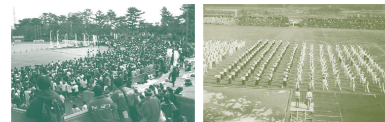
2014(平成26)年2月23日、およそ10,000人が参加した第10回浜松シティマラソン。メインスタンド側から見るグラウンド。市民も見学に来たスタンドもいっぱいである。(完成当時)