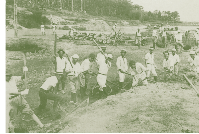
建設中の四ツ池公園。作業する市の職員の後方に中学生の姿が見える。

当時の市長、横光吉規は見聞の広い人物で、地域の拡大を唱えたり、大きな公的病院の誘致を実現したりしていた。またこの時代の浜松市内には市民が一堂に介してスポーツや催しをする施設がなく、横光は近代都市としての浜松の将来を見据え、新しい企画として陸上競技場や野球場、プールなどを備えた市民運動公園の設置を提案した。「ずいぶん思い切った施設なり」と報じられた。着工は1938(昭和13)年7月21日、9万2千円の工費だが、当時は、財政ままならぬ国内情勢であったこともあり、土木作業は、市内の多くの中学生(旧制)の勤労奉仕と浜松市職員などが参加して行われた。現在の四ツ池公園西側にあった山を崩し、その土で田畑が埋められた。着工から足かけ3年、手作業で夏も冬も工事は続けられようやく完成。グラウンドは、ギリシャの競技場をヒントに自然の地形を利用して造られたスタジアムというところもあり評判になった。