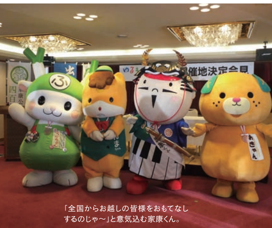
「全国からお越しの皆様をおもてなしするのじゃ〜」と意気込む家康くん。

ゆるキャラ®グランプリオフィシャルウェブサイト http://www.yurugg.jp/ 問/浜松市広聴広報課 TEL.053-457-2293