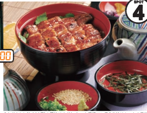
うなぎまぶし(3,000円)の薬味はネギとゴマ、お茶漬けに使う出汁はかつおの風味が効いたあっさり風味。

☎053-451-3131 国 浜松市中区砂山町354 国 浜松駅南口より徒歩3分 11:00~14:30(L.O.14:00)、16:30~20:00(L.O.19:30) ※うなぎがなくなり次第閉店 国 水曜夜、木曜 http://www.japan-net.ne.jp/~unasumi/