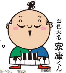
出世大名 家康くん

「万葉の森公園」は万葉歌に詠み込まれて草花の古名から推定される約300品種が四季を通して鑑賞できる施設です。 「万葉の森公園」周辺を散策し、万葉文化に触れてみてはいかがでしょうか。