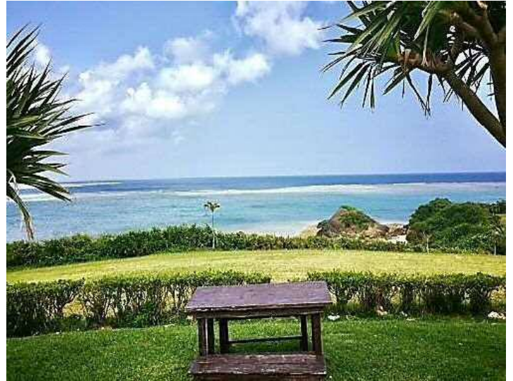
写真：石垣市で松田智生撮影