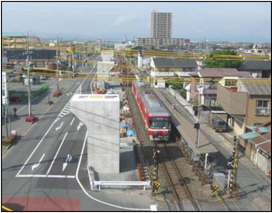
(曳馬駅付近から北側を望む)

平成16年度から静岡県が事業主体として工事を進め、平成19年度からは、政令市移行による事務移譲により、浜松市が事業主体となって工事を進めている。