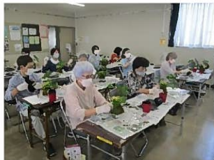
レディースセミナー(苔玉アレンジ)

提案のあった「クロマチックハーモニカ初心者講座」、「姿勢美人エクササイズ講座」を開催しました。