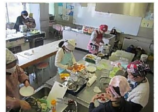
子ども講座(料理教室)