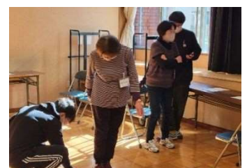
一日目の測定の様子