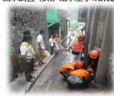
漏水工事の状況確認