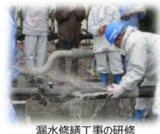
漏水修繕工事の研修