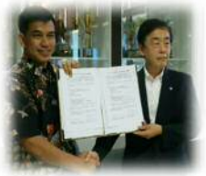
協力事項の署名式