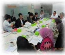
事業についての協議