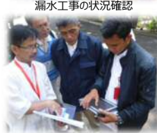
モデル地区での漏水調査