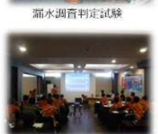
特別チームメンバーによる講義