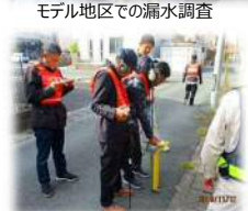
漏水調査判定試験