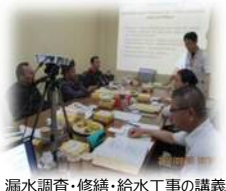
漏水調査・修繕・給水工事の講義