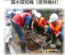
モデル地区で違法配管を発見