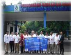
バンドン市水道公社・浜松市上下水道部の職員（バンドン市水道公社にて）