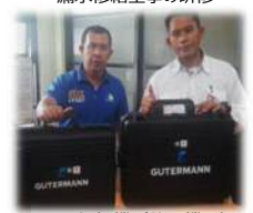
漏水探知機（使用機材）