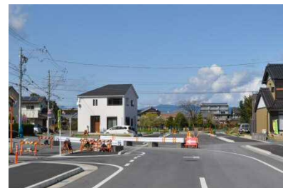
都市計画道路 美茵線