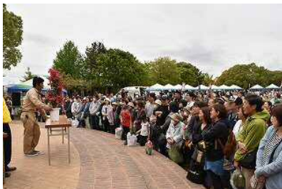
はまきたグリーンフェスタ

地域の活性化や文化振興のため、市民協働の視点を取り入れて、はまきたグリーンフェスタ(令和4年度は新型コロナウイルス感染拡大防止のため中止)、浜北産業祭、浜北植木まつり開催に係る経費を一部負担するとともに、浜北区市民文化祭などを実施します。