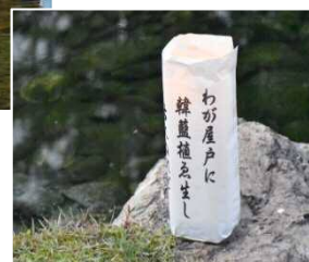
万葉の森公園(万葉まつりの様子)