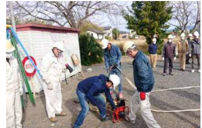
令和3年度 地域防災訓練

河川の氾濫が起きそうな時に、余裕をもって逃げるために事前に考えておく、一人ひとりの生活に合ったオリジナルの避難行動計画。