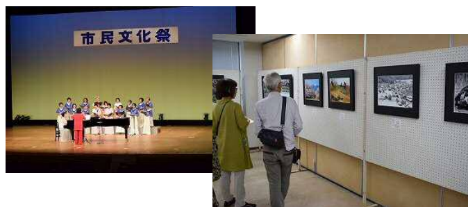
浜北区市民文化祭

※記載したイベントなどの事業については、新型コロナウイルス感染拡大防止のため、実施が取り止めになる場合があります。