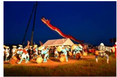
遠州はまきた飛竜まつり