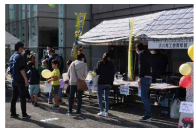
令和3年度に実施した地域力向上事業 「シン・発見！体験！実感！ いいね♪はまきた」

住みよい地域を実現するため、団体からの提案に基づき、市が公益上の必要を認め、団体が主体的に取り組む事業に対し助成します。