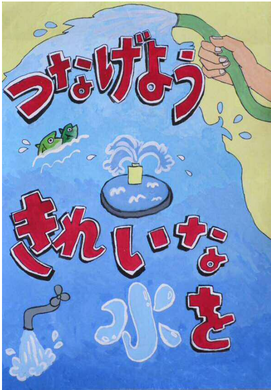
題名「つなげよう きれいな水を！」

「つなげよう」という言葉で、みんなできれいな水を守り、大切にしようという思いを伝えています。