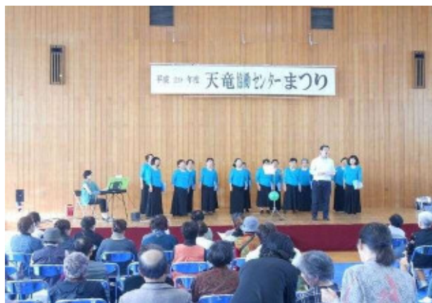
活動団体等による演技発表