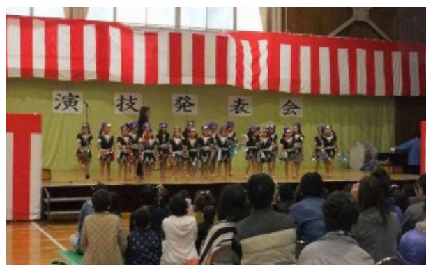
笠井幼稚園の遊戯発表