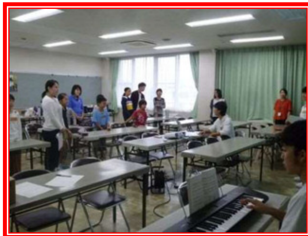
導入：幸せなら手を叩こう