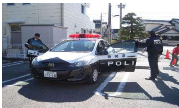
パトカーの乗車体験