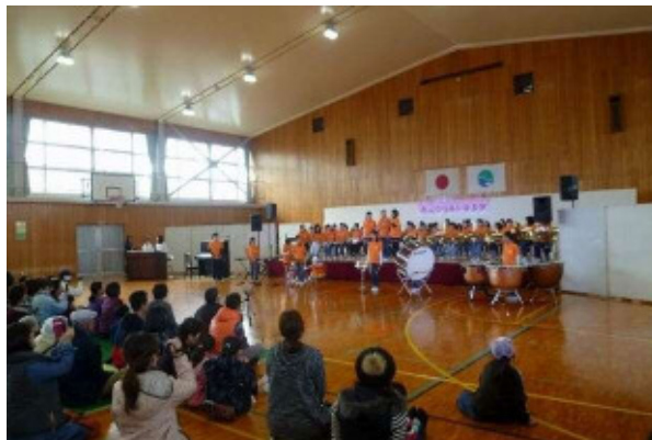
ふれあい音楽祭で聴衆を魅了