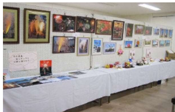
充実した作品展示