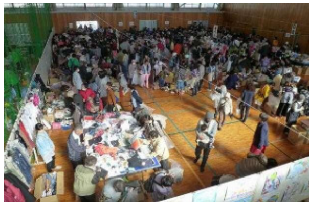
大盛況の婦人会バザー