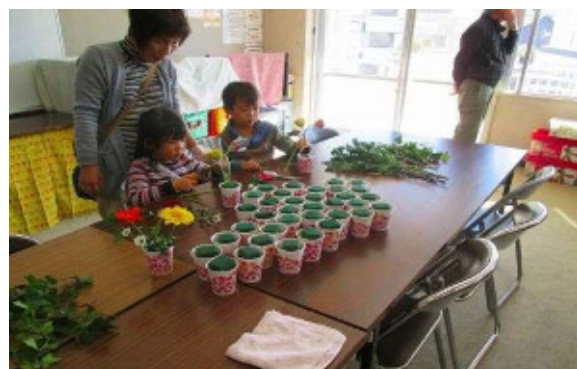
地域団体による体験コーナー