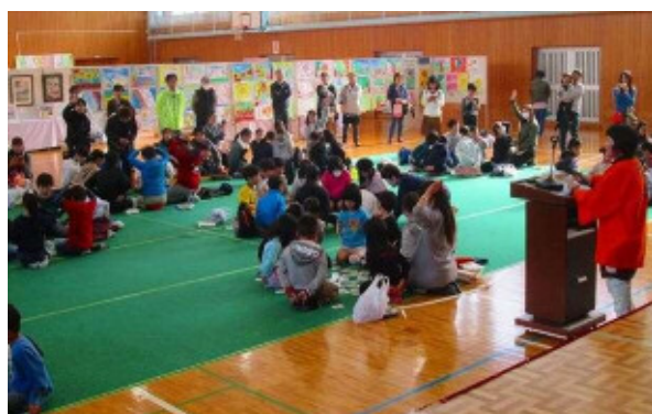
地域の子どもが参加するカルタ大会