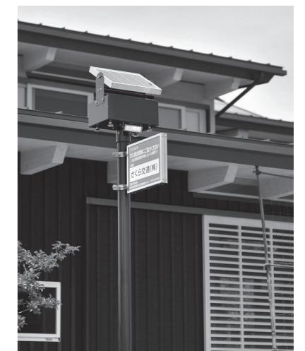
浜松市エコハウスモデル住宅の敷地に設置された、太陽光発電を利用したLED照明塔。

浜松市地球温暖化防止活動推進センター 中区西丘町951 ☎439-0909 HP http://www.hamaeco.org/