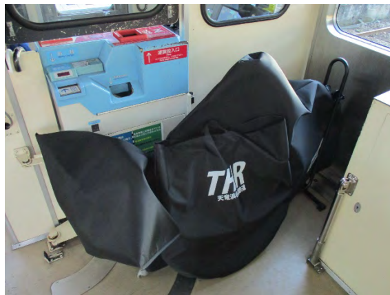
図 58 カバー式輪行バッグ