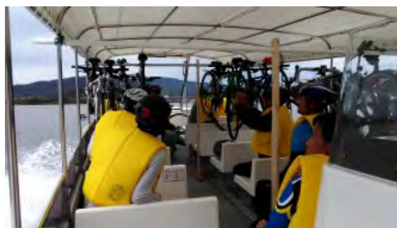
図 59 船を利用した移動