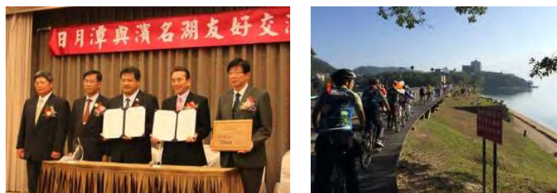
図 61 協定締結式と日月潭を周るサイクリストの様子