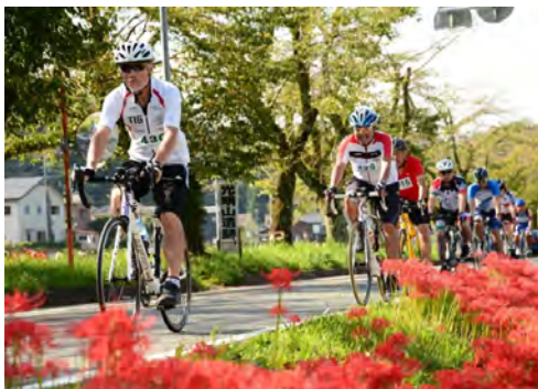
図 57 天竜サイクルツーリズム