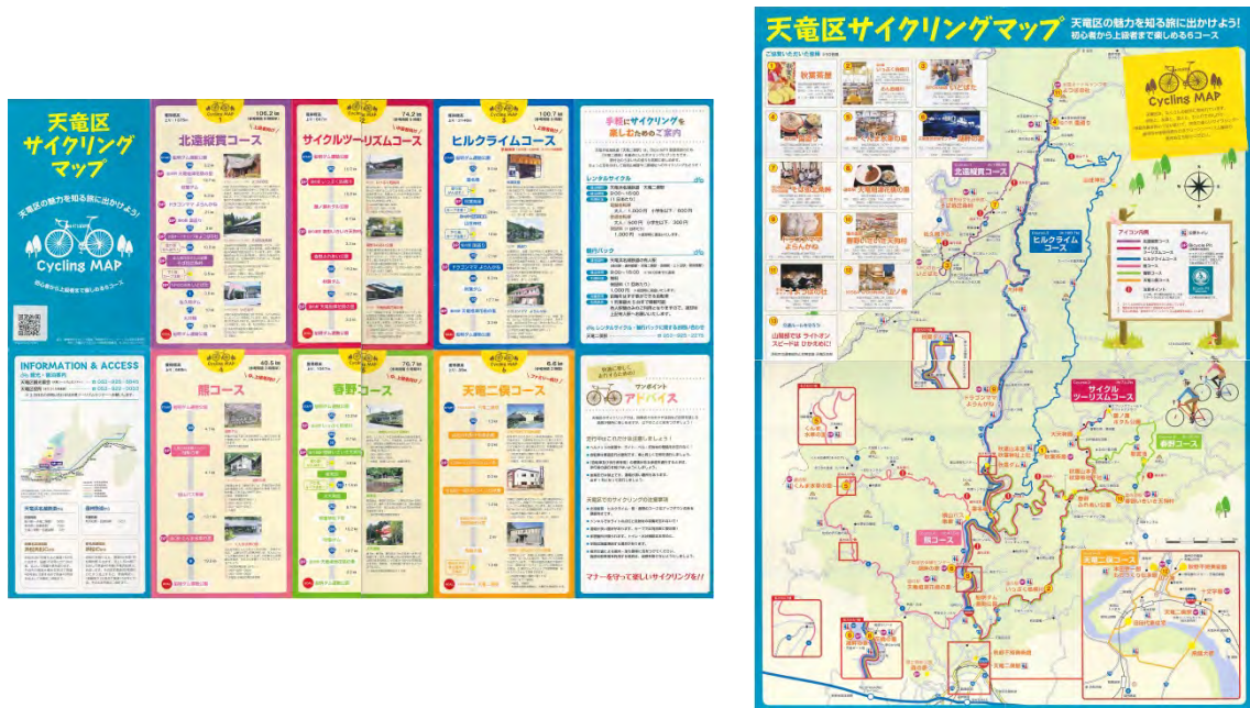
図 53 天龍区サイクリングマップ