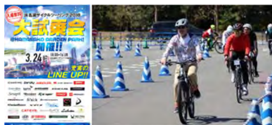
図 56 大試乗会の様子

浜名湖サイクルツーリングガイドライドと同時開催される自転車試乗会で、約20のメーカー(浜名湖サイクルツーリング2019実績)の自転車に無料で試乗することができます。