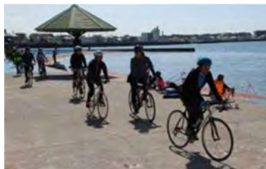
図 55 ガイドライドの様子

サイクルツーリングと同時開催されるガイド付きのサイクリングで、テーマ別にコースが設定されており、浜名湖周辺を1組15人程度で走りながら、観光や食を楽しむことができます。