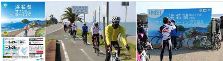
図 54 浜名湖サイクルツーリングの様子

浜名湖を一周するサイクリング大会が毎年3月に開催されています。コースは高低差があまりなく、速さを競わないことから、初心者でも気軽に参加できるイベントです。浜名湖岸をコースに設定しており、眺望を楽しめることも魅力です。