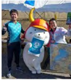
図 60 琵琶湖でのプロモーションの様子