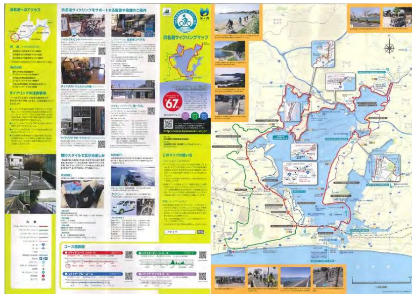
図 51 浜名湖サイクリングマップ