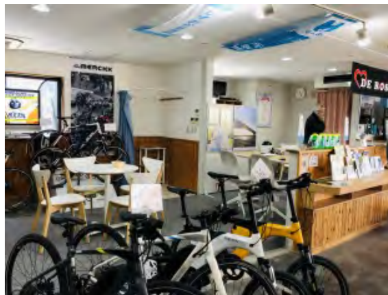
図 62 シェアサイクルショップ