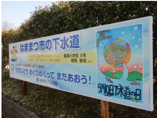
看板で最優秀賞作品を紹介 (上下水道部住吉庁舎)