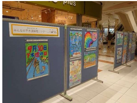
令和5年度受賞作品展示の様子 (イオンモール浜松志都呂)