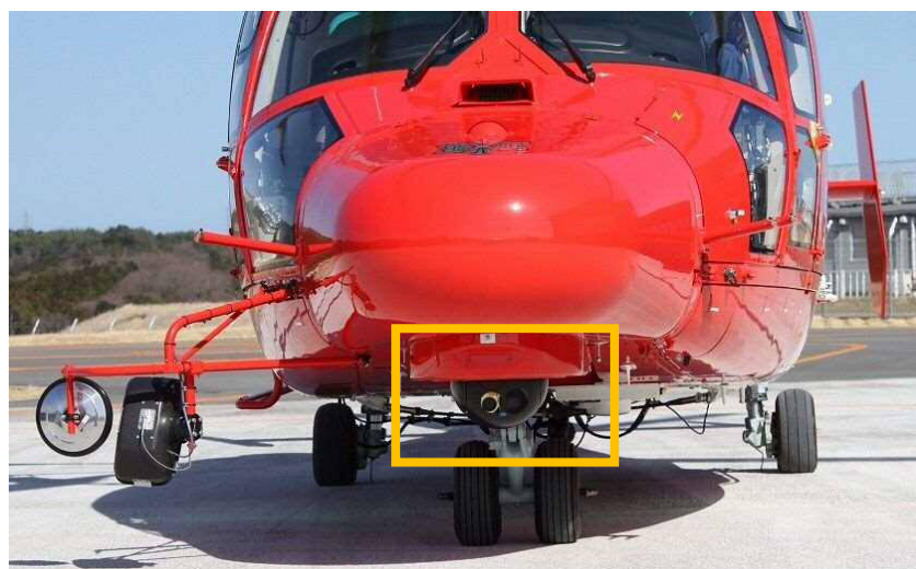
枠内：カメラ装置（災害救助活動等で使用するヘリコプターテレビ電送システム用）