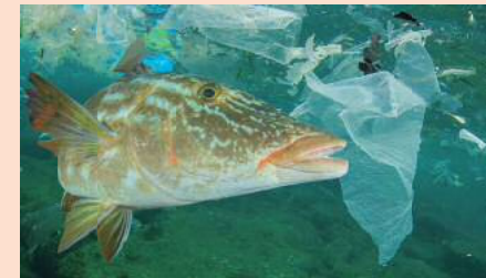
プラスチックごみがたくさん浮かぶ海で泳ぐ魚