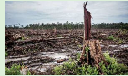
減少するインドネシアの森林