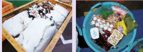
食品工場から捨てられたごはん 浜松市のごみ集積所に捨てられた食品