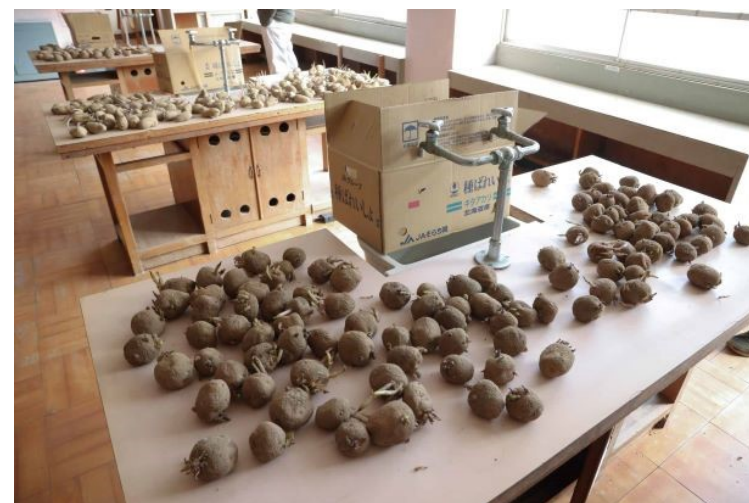
【廃校利用（じゃがいも育苗）の様子】

令和3年度に実施した遊休財産（9施設）の調査分析により公募を実施。その結果、3施設の契約を締結。