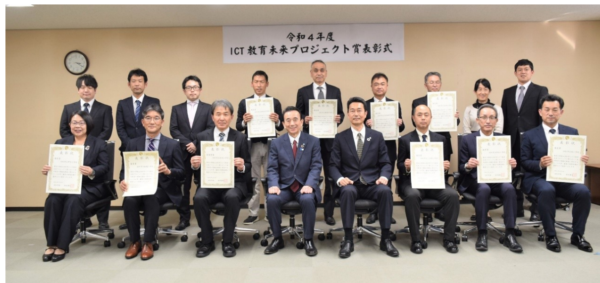
ICT教育未来プロジェクト賞表彰式での記念撮影