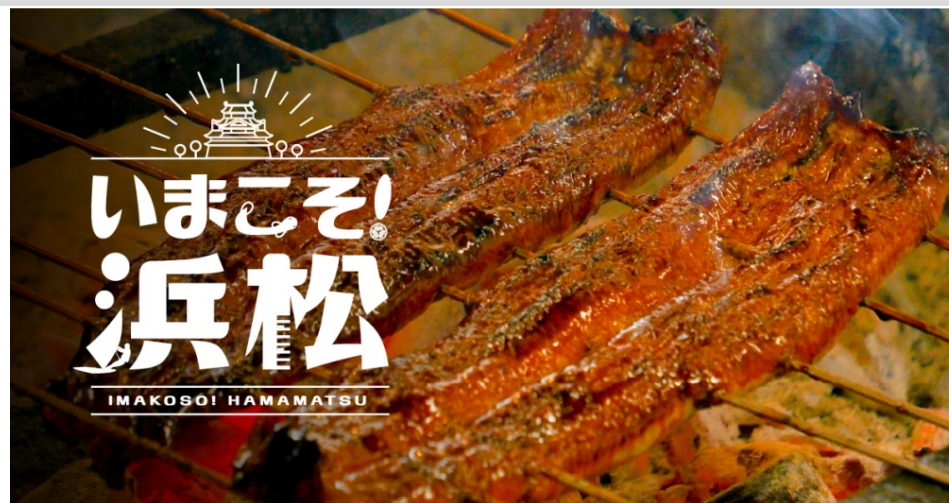
デジタルプロモーションにて作成した動画サムネイル(いまこそ！浜松)