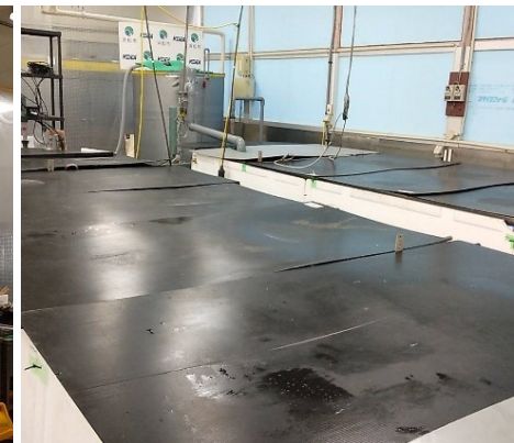
[養殖水槽（防温蓋付き）]