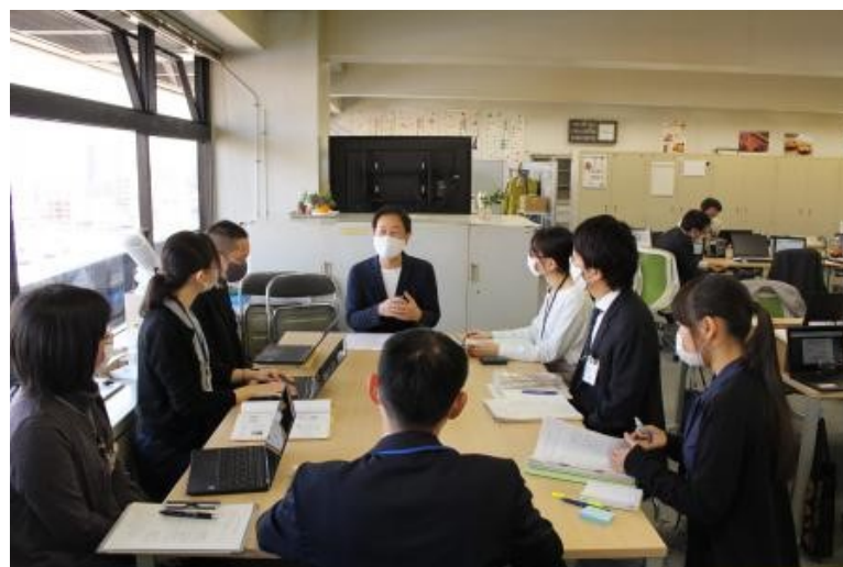
[村田プランナーとの情報発信WGミーティングの様子(場所:農業水産課)]