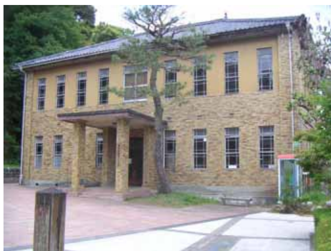
旧二俣町役場外観