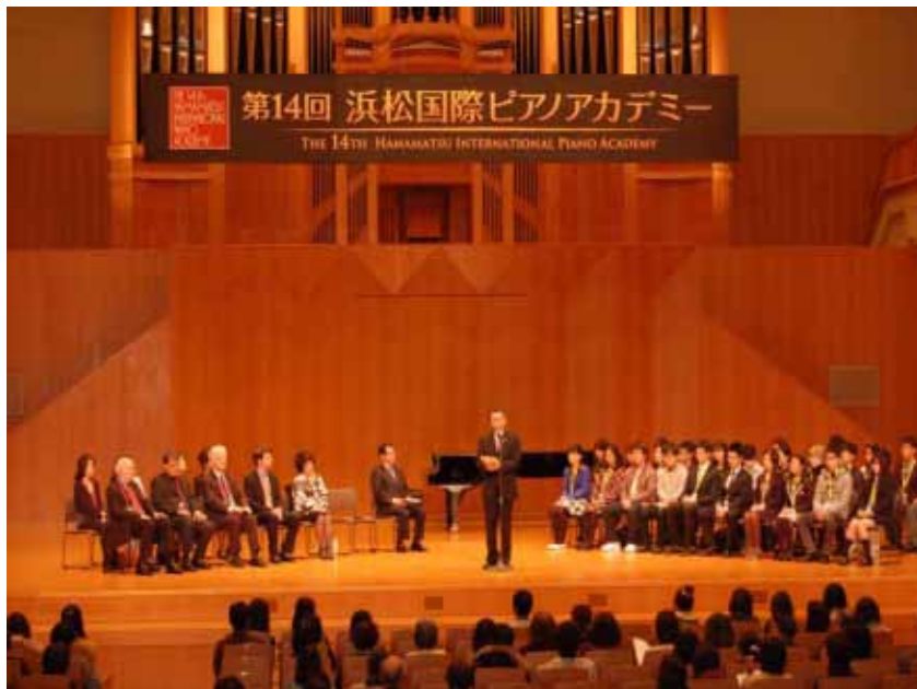
第14回浜松国際アカデミー（平成21年3月開催）