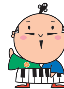
出世大名 家康くん

浜松市オレンジシール・オレンジメールとは、ひとり歩きによりご自宅に帰れなくなった人を警察や行政、地域包括支援センター(高齢者相談センター)、はままつあんしんネットワーク協力事業者、関係機関、地域の方々の方々の力でできるだけ早く、ご家族の元に帰れるようにする事業です。