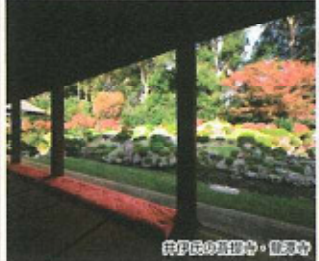
井伊氏の真摯心・健康心