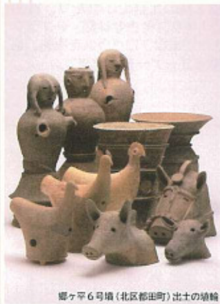
郷ヶ平6号墳(北区都田町)出土の埴輪

幅広い世代の方に文化財や歴史への興味を持っていただくために、地域の遺産を歩いて巡る「へりさんぽ」、自転車で巡る「ちゃりさんぽ」をはじめ、さまざまなワークショップ、イベントなどを開催しています。