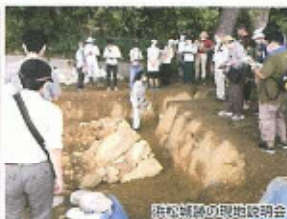
法隆寺跡の現地説明会