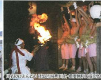
【名のひよんどり】村区別新町川原宿多摩郡歴史民俗文化館