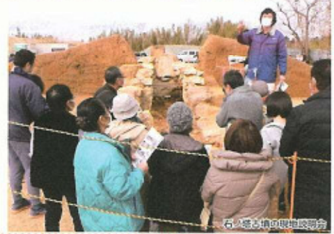
石ノ宮古墳の現地説明会

浜松市地域遺産センターでは、文化財をはじめとする地域に残された遺産の保存・活用・情報発信に取り組んでいます。