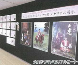
井伊伊予守のメモリアルコーナー