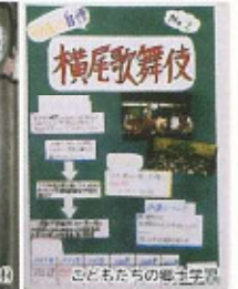
横尾歌舞伎 ことまちの郷土芸能