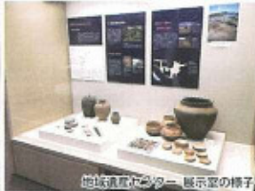
地域遺産センター 展示室の様子