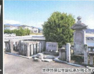
井伊共保公牛馬伝承が残る共同