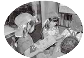
〈文字への関心を深める環境の例〉

大切なのは文字の直接指導をすることではなく、文字を使うことで文字を通して意味が伝わっていく面白さや楽しさが感じられるようにすることです。子供の「表現したい」「伝えたい」という気持ちを受け止め、遊びや生活の中で、幼児自身の必要感から、文字への興味・関心を深めていきたいものですね。