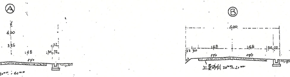
断面図 S = 1 / 100