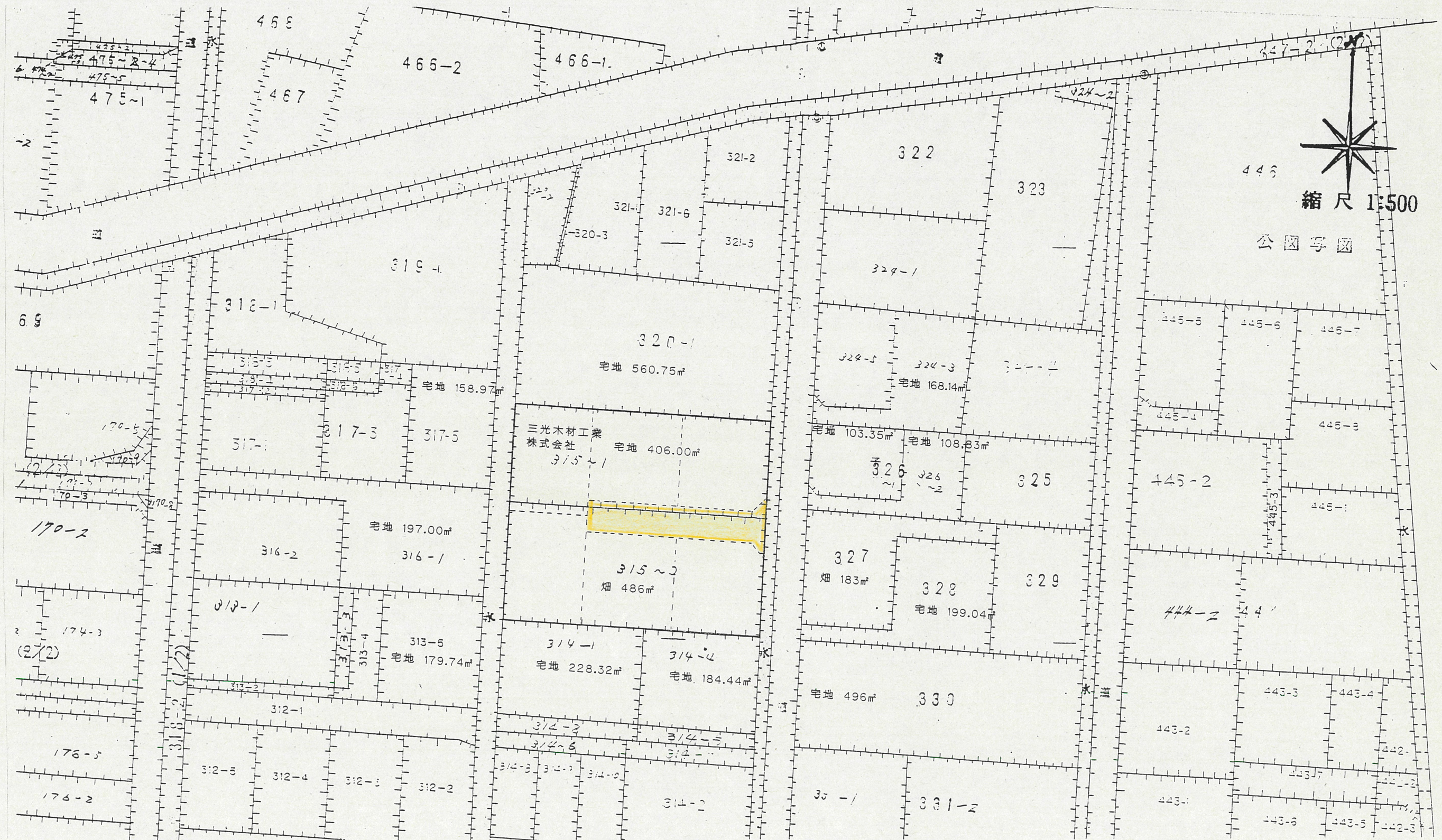
地籍図 (実測図及び公図写し)