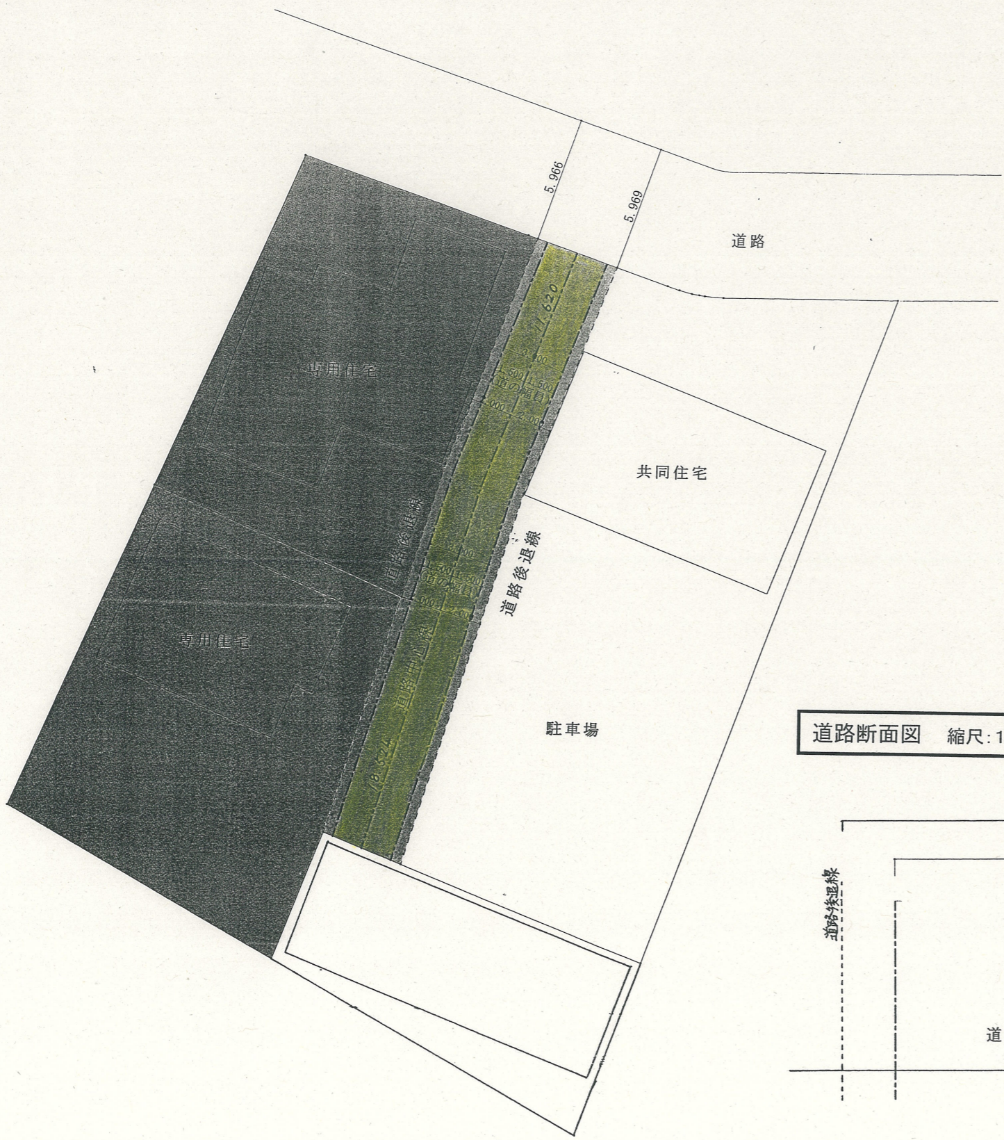
実測平面図 縮尺: 1/250