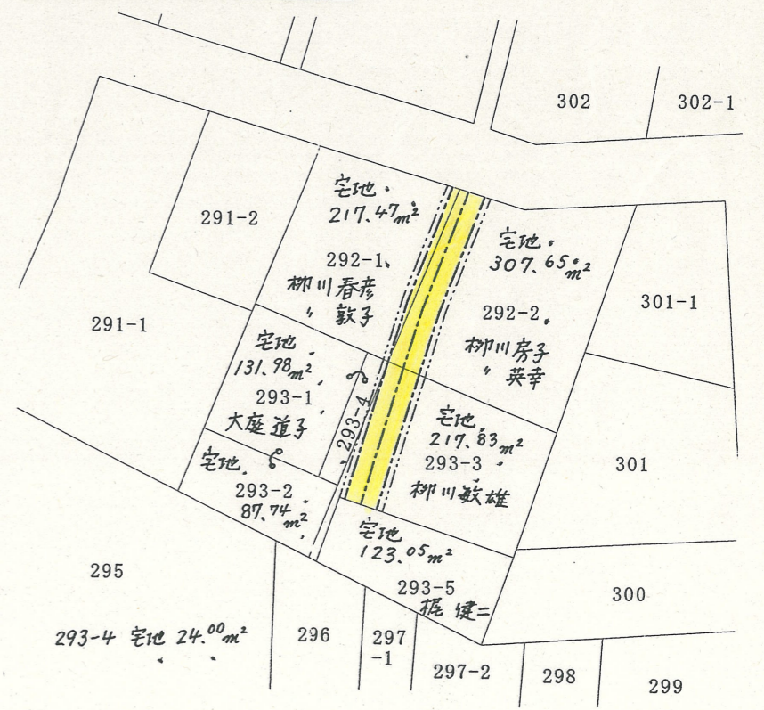
公図写 縮尺: 1/600