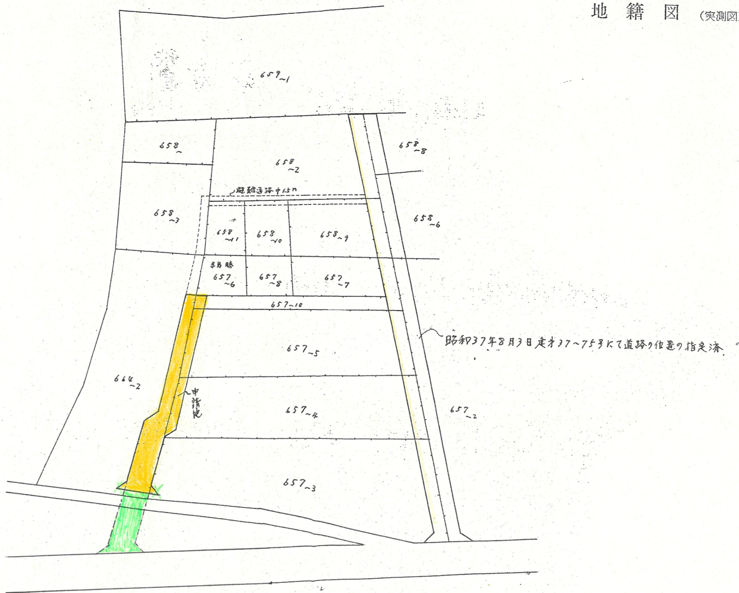
地籍図 (実測図及び公図写)