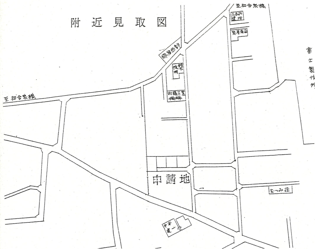
地籍図 (実測図及び公図写) S 1/600