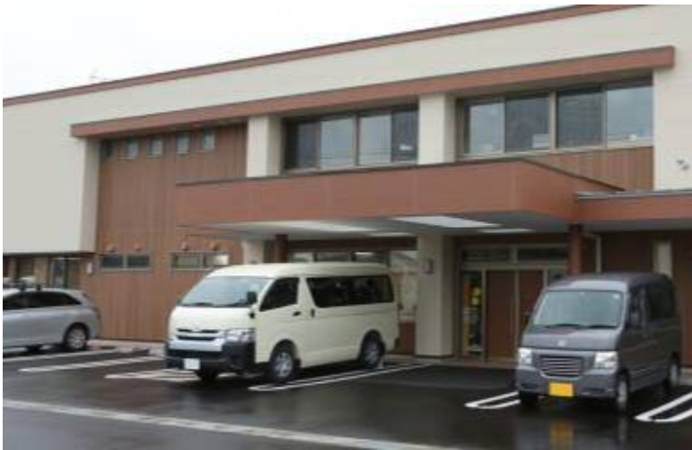
浜松市障害者就労支援センターふらっと