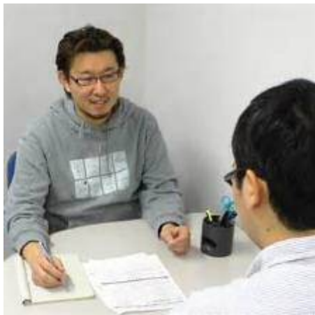
実施場所: ウィスティリアE-one