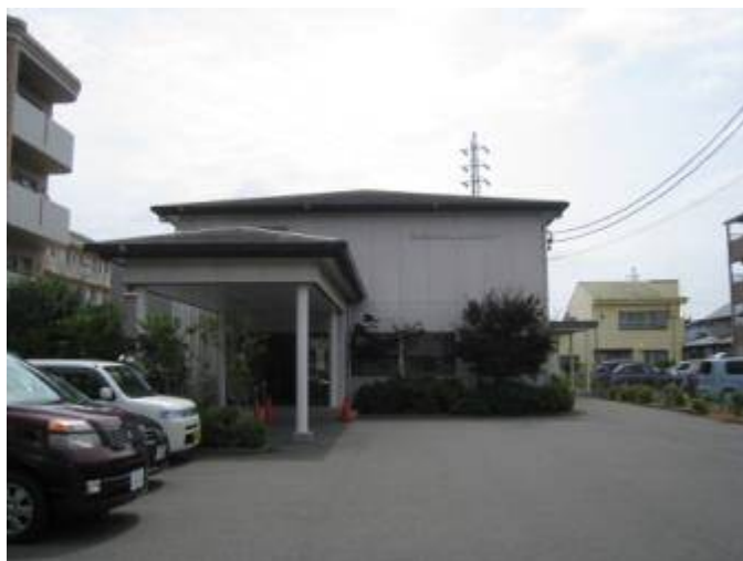
浜松家内労働福祉センター