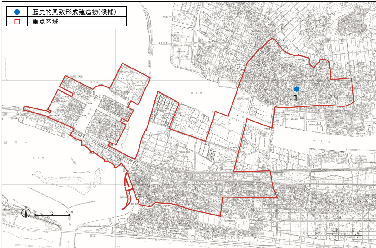
图7-4-1 歴史的風致形成建造物の指定候補分布図(表浜名湖地区)