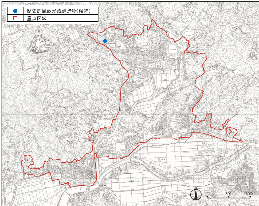
图7-4-2 歴史的風致形成建造物の指定候補分布図(奥浜名湖地区)