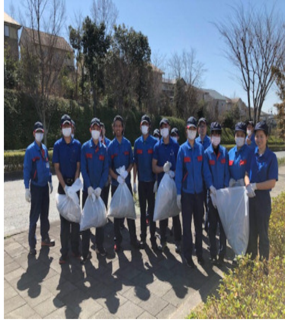
上：インドネシア男性 下：タイ女性