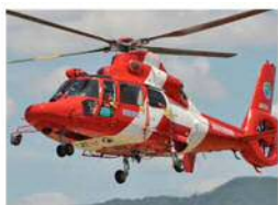
消防ヘリ『はまかぜ』