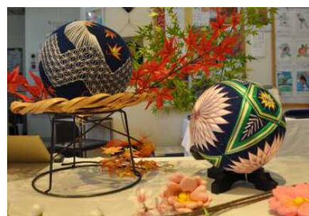
万葉の森公園(万葉まつりの様子)