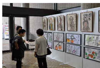
浜北区市民文化祭