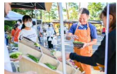
令和4年度に実施した地域力向上事業 LOCAL ACTION HAMAMATSU「森の朝市」

住みよい地域づくりを進めるため、区役所及び各協働センターに配置されたコミュニティ担当職員等が、市民協働・コミュニティづくりに対しての啓発や地域活動などへのサポートを通じ、地域の課題解決、活性化に取り組みます。