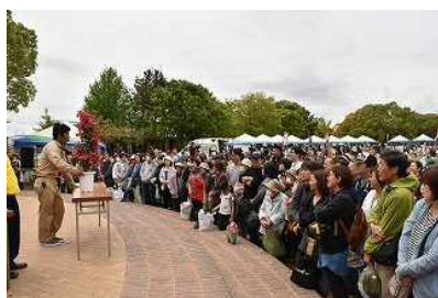
はまきたグリーンフェスタ

地域の活性化や文化振興のため、市民協働の視点を取り入れて、はまきたグリーンフェスタ、浜北産業祭、浜北植木まつりの開催に係る経費を一部負担するとともに、浜北区市民文化祭などを実施します。