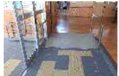
段差解消イメージ