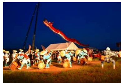
遠州はまきた飛竜まつり

浜北区の一大イベントとして、市民がともに楽しみ、互いに親睦と連帯感の高揚を図り、郷土愛を育むとともに地域産業の活性化と地域文化の創造を目的として開催する遠州はまきた飛竜まつりの開催に係る警備、会場設営などに対する経費を負担します。