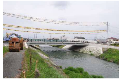
一般県道 細江浜北線(雷神橋)